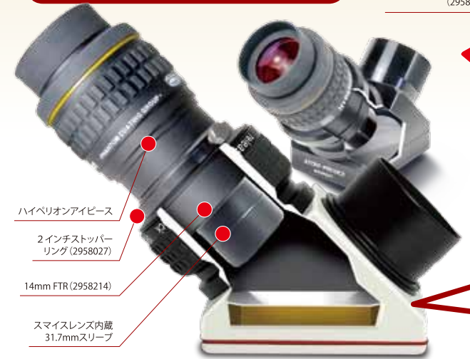
ハイペリオンアイピース

14mmのFTR、48mmフィルターと2インチストッパーリングを装着したハイペリオンアイピース。2インチストッパーリングを装着する事でアイピース側のスリーブ先端が天頂ミラー/プリズムと接触する事を防ぐ事ができます。