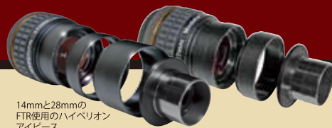
14mmと28mmのFTR使用のハイペリオンアイピース

ファインチューニングリングとバーダー製48mmフィルターの併用で、ハイペリオンアイピースの焦点距離と実視野を任意に変化させる事が可能です。