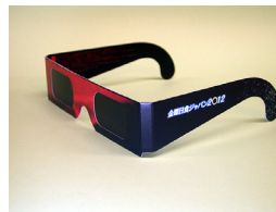
SEV-ND5 (サングラス / 1枚) 完売