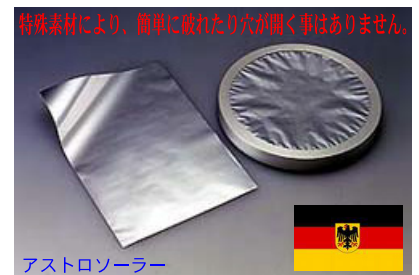
特殊素材により、簡単に破れたり穴が開く事はありません。