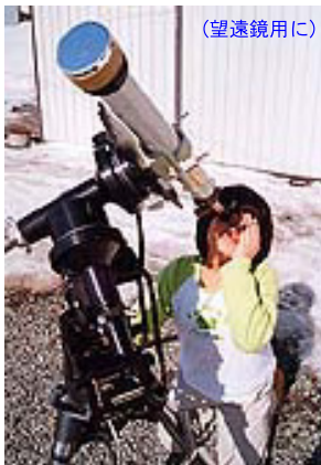
(望遠鏡用に) アストロソーラー (双眼鏡用に)

アストロソーラー (バーダー) : www.kkohki.com/Baader/astrosolar.html SEV-ND5 (サングラス) : www.kkohki.com/products/SEV.html